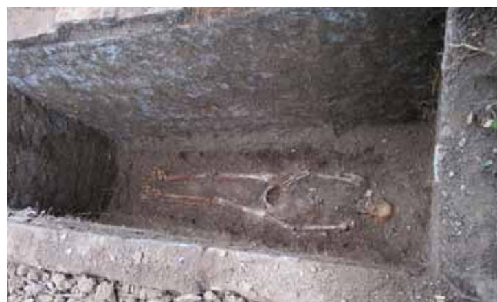
Hrob č. 2-2, poslední pohřbený