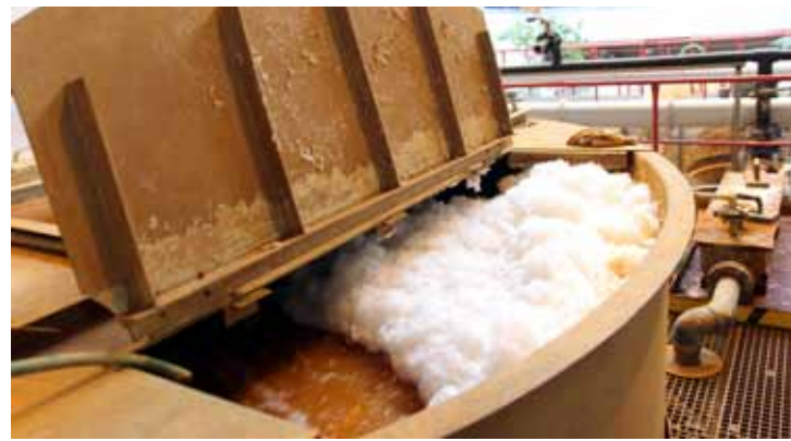
Čistírna důlních vod pracovala na plný výkon - 6,4 l za sekundu

středí MěÚ Kutná Hora, Obvodní báňský úřad pro Stř. kraj a Hlavní město Prahu, HZS Kutná Hora. Náhlé vzednutí hladiny způsobilo zřejmě propad horniny, uvolnění většího množství materiálu v podzemí nad některou z četných vydobytých komor Turkaňského pásma. Byla přijata další opatření - na potrubí pro vypouštění důlních vod ze štol 14 pomocníků byla instalována uzavírací armatura, která umožní při případném nárůstu hladiny výtok okamžitě uzavřít, čímž by bylo zamezeno dalšímu výtoku vod do toku Beránka. V souladu s rozhodnutím o opatření k nápravě, které vydal MěÚ Kutná Hora, bylo zadáno vypracování dokumentace postupu sanačních prací pro dekontaminaci povrchových vod a sedimentu v toku Beránka a Klejnárka. „S ohledem na výsledky průzkumných prací zpracovaných v projektu nápravných opatření pro odstranění následků havárií na vodním toku Be-