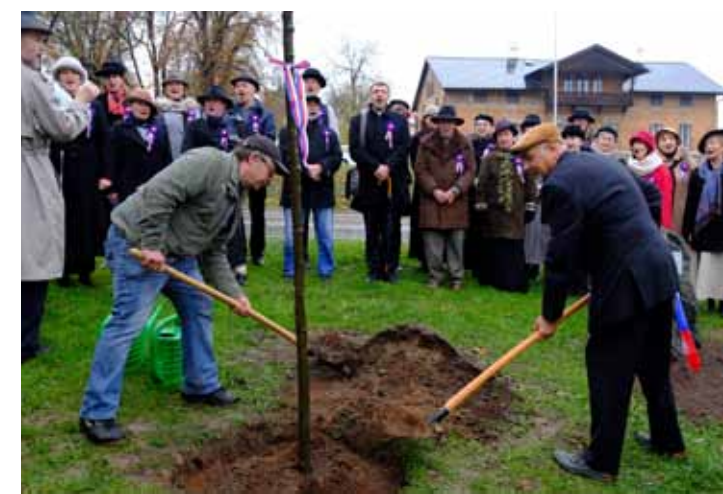
Součástí oslav bylo zasazení památné lípy k 100. výročí ČSR v České ulici.

100. výročí vzniku Československé republiky doprovázela v Kutné Hoře po celý rok řada kulturních a společenských akcí. Součástí programu, do kterého se zapojila řada organizací a institucí ve městě, byly výstavy, koncerty, před-