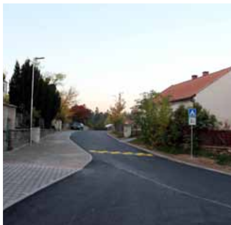
Rekonstrukce ulic na Kaňku