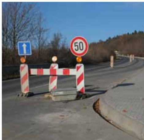
Stezka pro chodce a cyklisty Sedlec - Kaňk