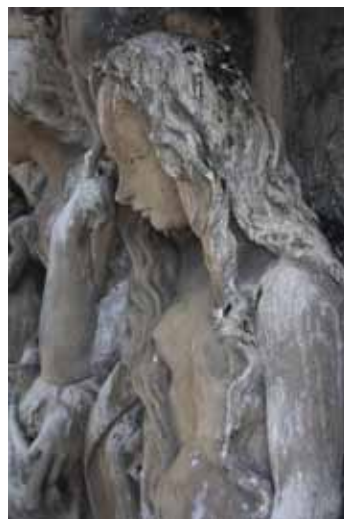
Eva, před restaurováním, detail.