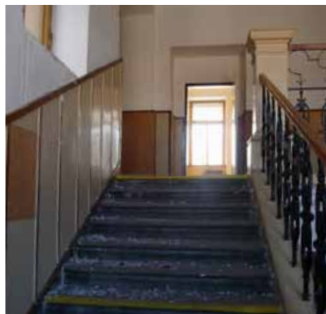
Schodiště v bývalé ZŠ J. A. Komenského