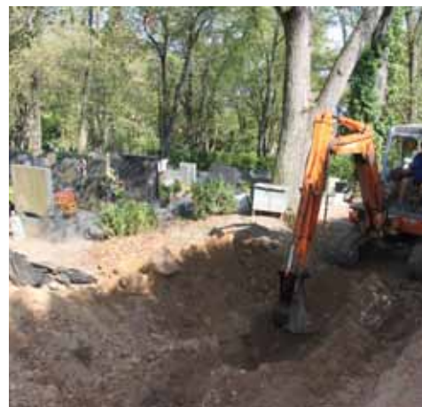
Hřbitov - z průběhu prací v září 2018