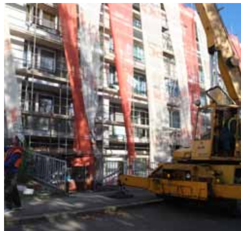
Bytový dům Benešova ul.