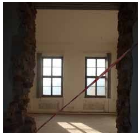
Vlašský dvůr - rekonstrukce