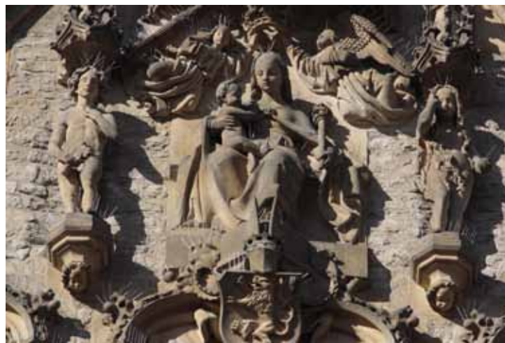
Madona s Ježíškem, Evou a Adamem, po restaurování a osazení bodel