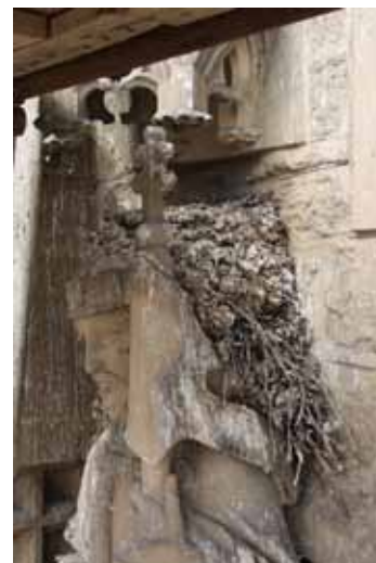
Sv. Ladislav s nánosy holubích exkrementů