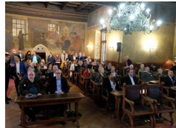
Následovalo slavnostní zasedání v audienční síni Vlašského dvora za přítomnosti významných hostů a zástupců partnerských měst Kutné Hory.