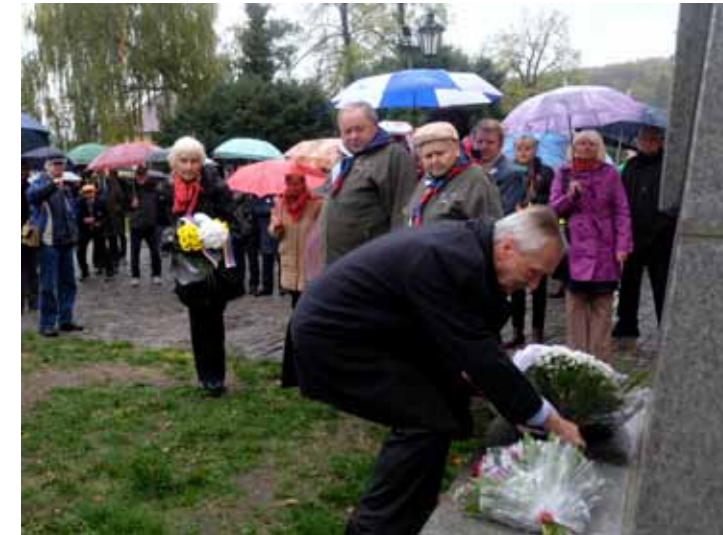
Ani nepřízeň počasí neodradila v neděli 28. října návštěvníky k účasti na oslavách 100. výročí vzniku Československé republiky. Představitelé města spolu se zástupci organizací položili kytice k památníku T. G. Masaryka, zazněla hymna v podání USPS Tyl.