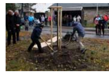
Vysazení lípy v Malíně

Stromy svobody vysazené k výročí republiky je možné re-