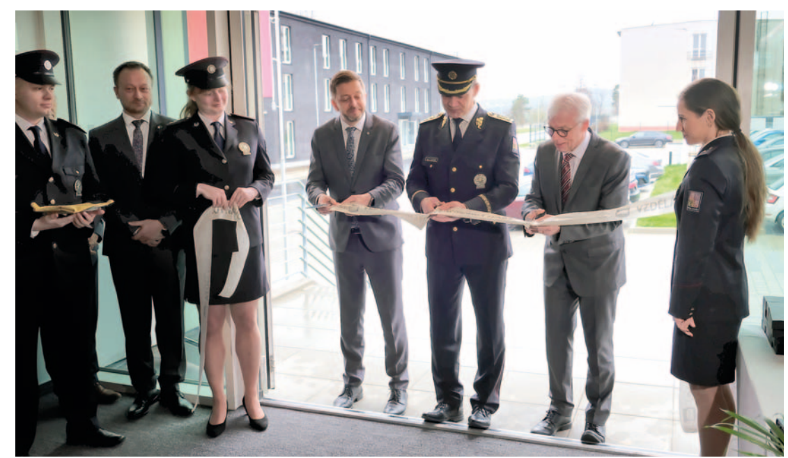
Provoz nového moderního policejního výcvikového a vzdělávacího zařízení, které vzniklo přestavbou části areálu bývalých kasáren na Žižkově v Kutné Hoře, byl slavnostně zahájen 12. března symbolickým přestřížením pásky. Více na str. 20.

Na titulní straně: Jarní náladu v centru města u morového sloupu v Šultysově ulici podtrhují trhy se záplavou květin. Foto: M. Pravdová Kutnohorské listy – městský zpravodaj, měsíčník. Vycházejí od roku 1881. Periodikum územního samosprávného celku. Vydává město Kutná Hora, IČO 00236195. Ev. č. MK ČR E 10522. Náklad 10 500 ks. Redakce: J. Brandejská, R. Krejčí, D. Procházková, M. Pravdová (šéfredaktor). Redakční rada: Lenka Frankovicová, Tzeta Morawski Kambourová, Radka Krejčí, Jiří Kukla, Jakub Obraz, Ladislava Růžičková, Jakub Skyva, Robert Svoboda a Jiří Nedvěd (předseda RR). Redakce, inzerce, reklamace: Kutnohorské listy, Městský úřad Kutná Hora, odbor cestovního ruchu, školství a kultury, kontakt 327 710 112, 327 710 151 (inzerce), e-mail redakce@kutnohorskelisty.cz. Sazba a tisk: Grafia Gryč. Distribuce: město Kutná Hora. Příspěvky zaslané do redakce mohou být kráceny a redakčně upraveny. Příspěvky některých autorů mohou vyjadřovat názory pisatele a nemusejí se shodovat se stanoviskem vydavatele. Toto číslo vychází 28. března 2024. Uzávěrka příspěvků do příštího čísla je 12. dubna 2024. www.kutnohorskelisty.cz