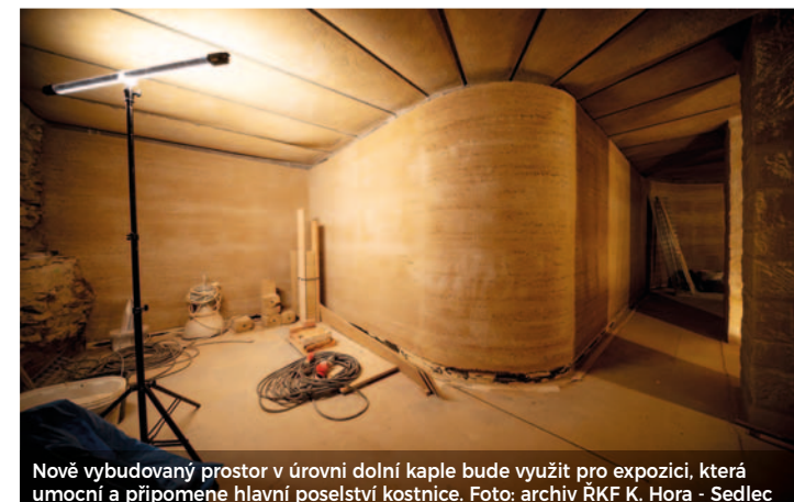
Nově vybudovaný prostor v úrovni dolní kaple bude využit pro expozici, která umocní a připomene hlavní poselství kostnice.