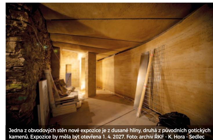
Jedna z obvodových stěn nové expozice je z dusané hlíny, druhá z původních gotických kamenů. Expozice by měla být otevřena 1. 4. 2027.