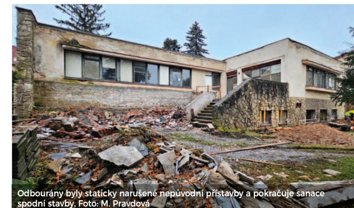
Odbourány byly staticky narušené nepůvodní přístavby a pokračuje sanace spodní stavby.

Uvítáme dobové fotografie Zelenkovy vily a okolí a vzpomínky pamětníků. Pište prosím na adresu: pravdova@mu.kutnahora.cz.