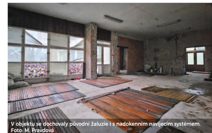
V objektu se dochovaly původní žaluzie i s nadokenním navijecím systémem.