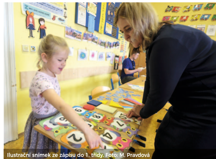
Ilustrační snímek ze zápisu do 1. třídy.

Do první třídy se budou zapisovat děti narozené v období od 1. 9. 2018 do 31. 8. 2019. Je možné zapsat i děti mladší, znovu k zápisu se svými dětmi