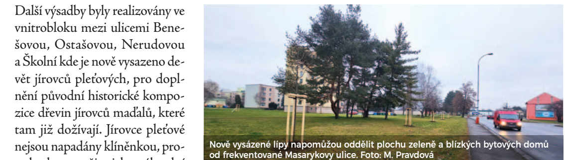
Nově vysazené lípy napomůžou oddělit plochu zeleně a blízkých bytových domů od frekventované Masarykovy ulice.