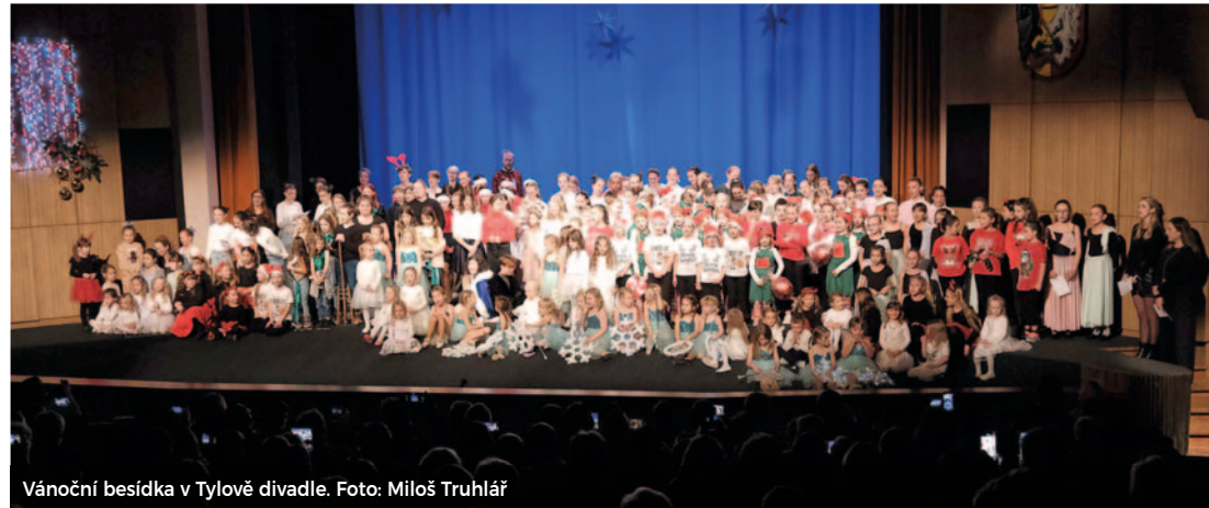
Vánoční besídka v Tylově divadle.

Rád bych tímto poděkoval účastníkům našich kroužků a kurzů za přízeň, všem, kdo navštěvují naše akce, a hlavně externím pedagogům, kteří zabezpečují volnočasové aktivity, v letošním roce jich je neuvěřitelných 56. Velký dík patří také interním zaměstnancům, jak provozním, tak pedagogickým. O provoz domečku se starají pan údržbář, paní uklízečka, paní ekonomka a tři pedagožky, na kterých stojí všechny aktivity. Velké díky všem a hodně