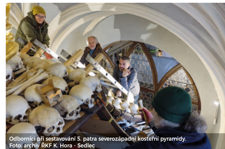
Odborníci při sestavování 5. patra severozápadní kosterní pyramidy.

V roce 2024 farnost do obnovy sedlecké kostnice investovala 16 milionů korun. Celkové náklady od zahájení záchranu objektu se pohybují kolem 120 milionů korun. M. Pravdová