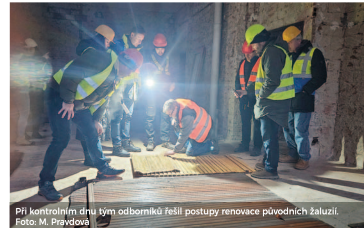
Při kontrolním dnu tým odborníků řešil postupy renovace původních žaluzií.