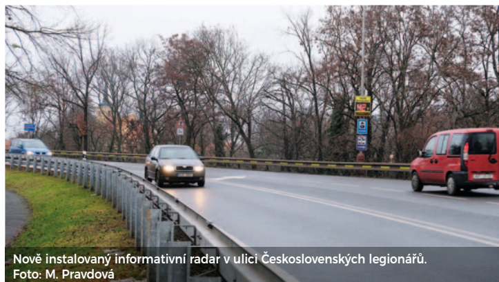
Nově instalovaný informativní radar v ulici Československých legionářů.