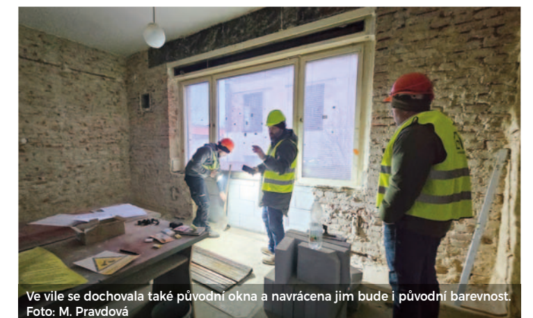
Ve vile se dochovala také původní okna a navracena jim bude i původní barevnost.