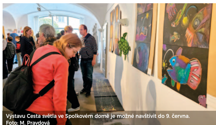
Výstavu Cesta světla ve Spolkovém domě je možné navštívit do 9. června. Foto: M. Pravdová

KIKS. Festival pokračoval dalším programem, vystoupeními a otevřenými hodinami pro veřejnost. M. Pravdová