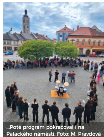
...Poté program pokračoval i na Palackého náměstí.

Palackého náměstí 13. května. Společně s bubenickou skupinou Tympanon se do něj zapojil také Dechový orchestr