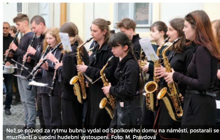
Než se průvod za rytmu bubnů vydal od Spolkového domu na náměstí, postarali se muzikanti o úvodní hudební vystoupení.

Hudební zážitek při vernisáži zajistili žáci hudebního oboru pod vedením Vojtěcha Hylského.