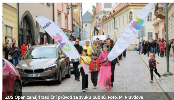
ZUŠ Open zahájil tradiční průvod za zvuku bubnů.